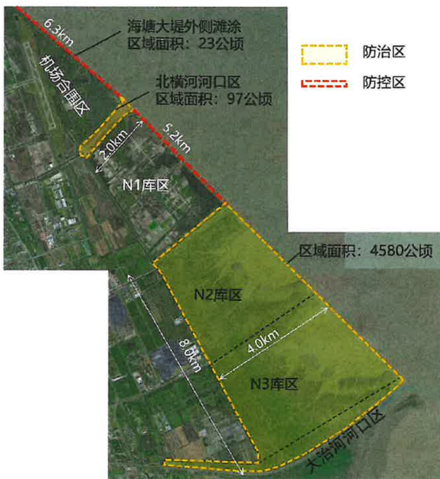
图 1-1 工程范围示意图

该工程位于南汇东滩大治河以北区域，防治范围包括：N2、N3 库区，大治河北岸河口区，北横河河口区，以及机场合围区与 N1 库区的一线大堤外侧滩涂。